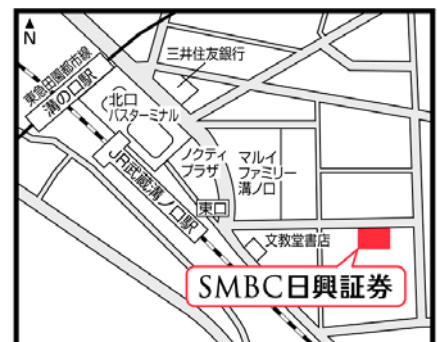
JR武蔵溝ノ口駅東口・ヴェルビュ溝の口8階

支店名: 溝ノ口支店 住所: 〒213-0011 神奈川県川崎市高津区久本三丁目2番3号 ヴェルビュ溝の口8階 開設予定日: 2014年10月28日(火)