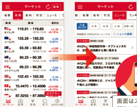
画面はスワイプして瞬時に切り替え

株価指数、為替、金利の動向から株式市況やニュースなど、充実したマーケット情報をご覧いただけます。