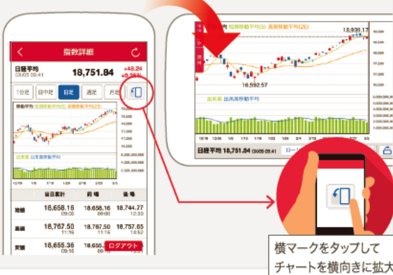
横マークをタップしてチャートを横向きに拡大

株式チャートは横画面に切り替えると拡大表示。チャートの種類や設定の変更も自在です。