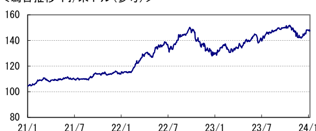
<為替推移 円/米ドル(参考)>

※当レポート中の各数値は四捨五入して表示している場合がありますので、それを用いて計算すると誤差が生じることがあります。