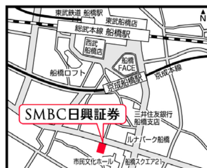
太陽生命船橋ビル5階

支店名: 船橋支店 住所: 〒273-0005 千葉県船橋市本町二丁目27番25号 太陽生命船橋ビル5階 開設予定日: 2014年10月14日(火)