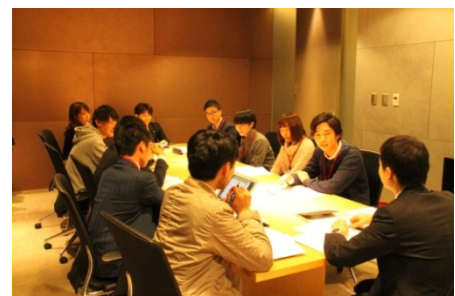
<大学生とのディスカッションの様子>

SMBC日興証券とオーシャナイズは、大学生の生の声を聞きながら、必要な金融リテラシーを大学生と一緒に考え、より多くの大学生に発信していく取り組みを継続的に実施してまいります。本プロジェクトの始動に先立ち、専用Webサイトを公開いたしました。専用Webサイトには、大学生向けに、大学生の現状に関するアンケート結果や、今後のライフプランを考える上で必要な情報、基本的な金融知識についての学習コンテンツ等を掲載してまいります。尚、本プロジェクトの始動および専用Webサイトの公開については、オーシャナイズの「タダコピ ※4 」サービスで、約200キャンパスの大学生に案内しております。また、2月13日(金)の「NISAの日」に、大学生が金融リテラシーについて学び考えるイベントを実施いたします。本イベントは、大学生が、ディスカッションやクイズを通して、ライフプランニングの必要性や将来に向けた資産形成について考えていくプログラムとなっております。本日より専用Webサイトにて大学生からの参加希望の受付を開始いたしました。