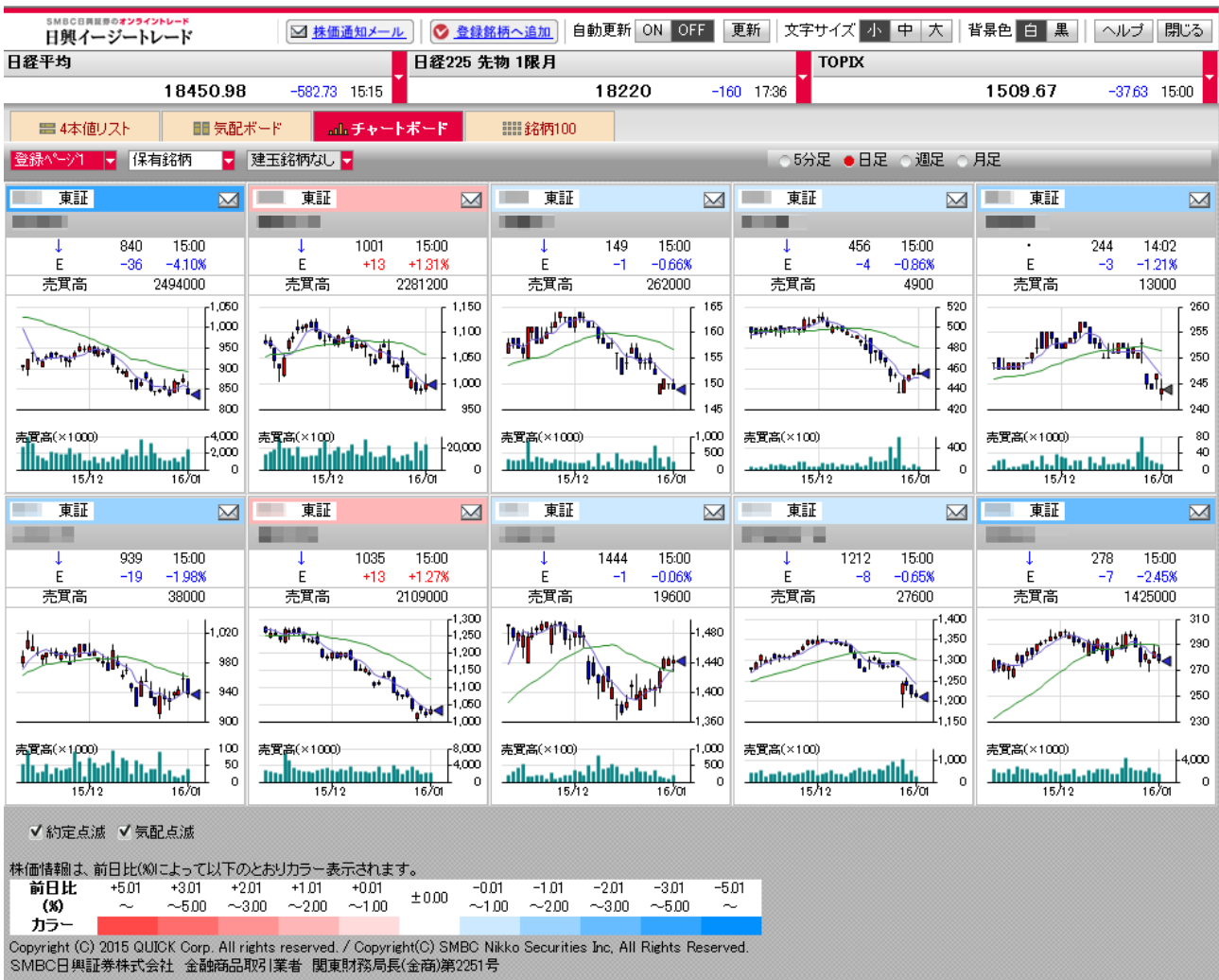
<「チャートボード」画面イメージ>