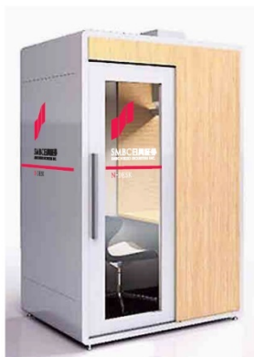
「ソロワークブース CocoDesk」の外観