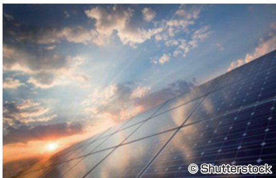
上記は、イメージ写真です。

Crédit Agricole CIBは、2010年から2013年にイタリア（プリア州、ラツィオ州、シチリア島）で稼働した18の太陽光発電事業への融資/支援等を行いました。このプロジェクトにより、この発電所を保有する企業は、イタリアにおいて最も太陽光発電を保有する企業の1社となりました。この企業は、開発、建設から運用、管理まで、エネルギーチェーン全体を網羅しており、風力および太陽光発電や、太陽熱のプロジェクトへの長期投資を継続して行う予定です。