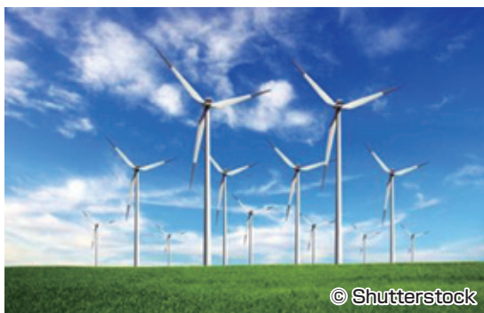
上記は、イメージ写真です。

Crédit Agricole CIBは、カナダの陸上風力発電所への融資/支援を行っています。この発電所の建設は2017年に開始され、2019年初旬まで続く予定です。この発電所の建設により、年間約85万トンの二酸化炭素の排出量が回避され、年間約20億リットルの節水が可能になります。