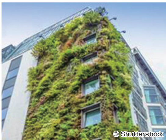
上記は、イメージ写真です。

* 3 NABERSとGreen Starは、オーストラリアの不動産に係る環境性能評価認証です。