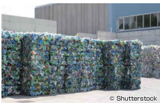
上記は、イメージ写真です。

Crédit Agricole CIBは、イギリスの廃棄物発電施設への融資/支援等を行いました。この施設の建設は2016年7月に開始され、2019年6月に完了する予定です。この施設では、稼働段階で、毎年56万トンの廃棄物の処理が可能となる予定です。